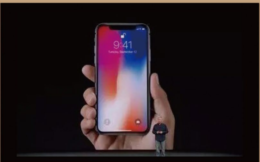
iPhone X, 256G