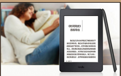
Kindle Paperwhite 3